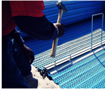
Schritt 2: befestigen