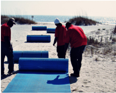
Schritt 1: ausrollen