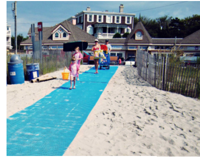
Schritt 3: nutzen